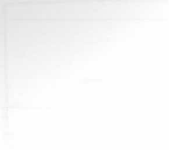
PLATE 12. THE TEMPLE OF ANKHSAMEN

1. The temple of Ankh-Samen, the son of Amenhotep III, is situated in the West Valley of the Nile, near the village of Assiut. It was discovered in 1897 by Gardiner and Sethe. The temple is a fine example of the art of the late 19th century B.C. It consists of a large open-air court, a colonnade of papyrus columns, and a sanctuary. The columns are decorated with hieroglyphs and lotus flowers. The sanctuary contains a statue of the god Ankh-Samen. The temple is now in the care of the Egyptian Museum, Cairo.